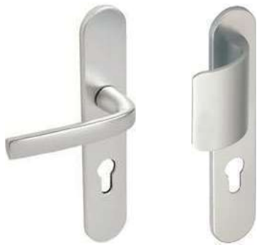
Béquille sur plaque