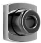
Protecteur de cylindre avec rosace extérieure