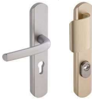
Béquille sur plaque