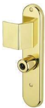
Béquille / Aileron / Bouton sur plaque