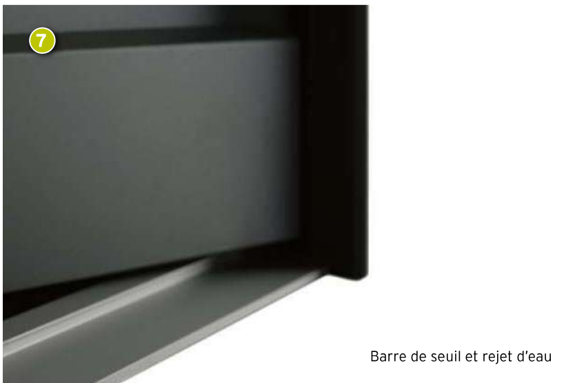
Barre de seuil et rejet d'eau