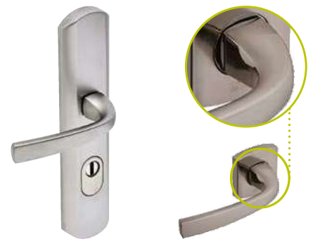
Béquille sur plaque extérieure