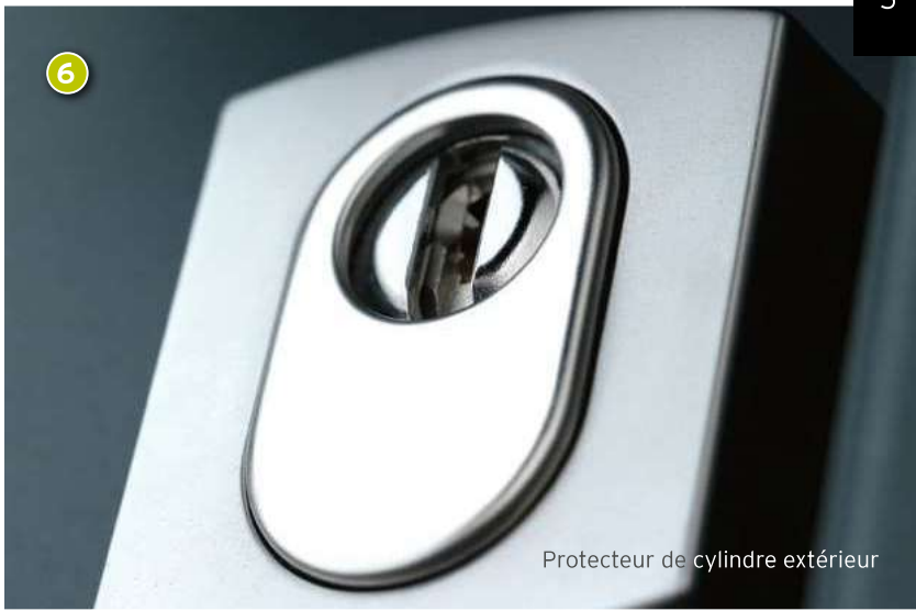
Protecteur de cylindre extérieur