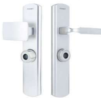
Aileron sur plaque