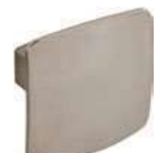
Pommeau central extérieur