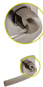
Béquille sur rosace