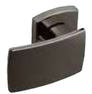
Aileron sur rosace extérieure