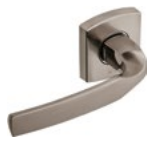
Béquille sur rosace